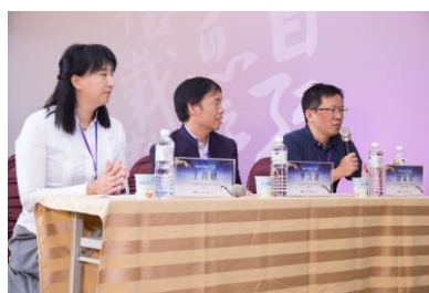
鴻嬪學姊主持及與談人次會、家祥學長