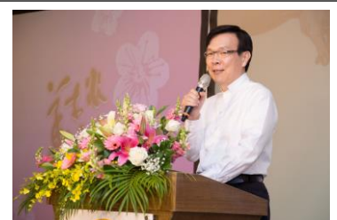
新任會長惠中學長致詞