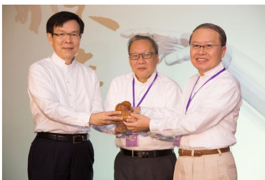
主秘見證下新舊任會長交接

不但扣緊了此次年會主題“未來”，同時也依文演繹，讚許、嘉勉 TEN/TEEC 會員用智慧互相成就，也樂於回饋與付出。也期勉可以用“事業”支持“志業”；“而志業”可以變成“事業”。惠中會長精彩又深刻的致詞，博得滿堂彩，也感動了許多人。而新任的副會長進步學長，則期望 TEN 與清華百人會（進步學長目前是清大百人會會長）能有更緊密的結合。