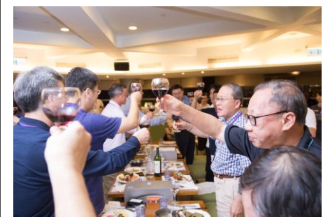
歡迎晚宴學長姐們齊聚舉杯