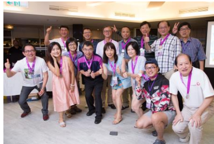
躲避球藍隊榮獲銀牌