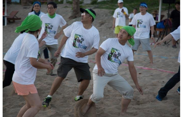
躲避球綠隊精彩防守