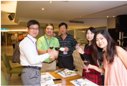
學長姊們歡迎晚宴合照