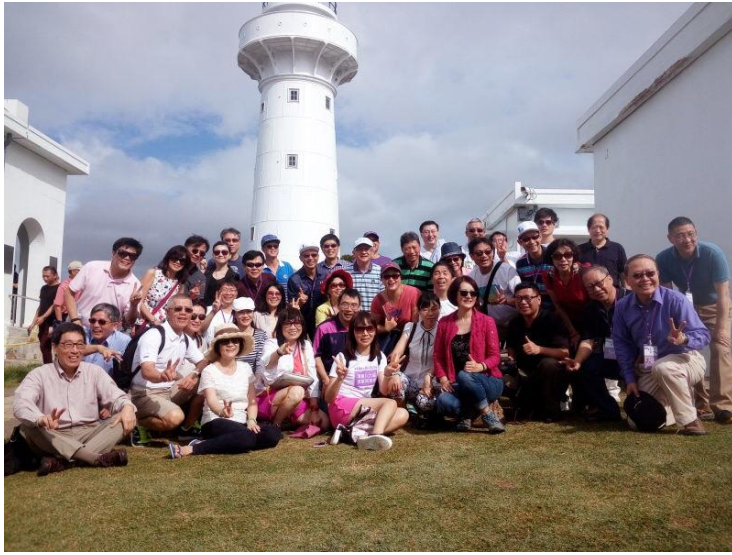
學長姐們於鵝鑾鼻燈塔大合照