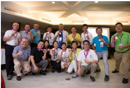
躲避球綠隊榮獲金牌