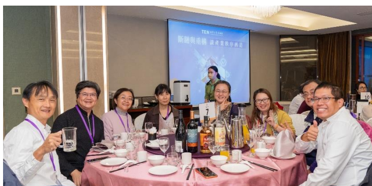
▲ 學長(左二) 2025 年參加 TEN 阿里山年會與 TEN 友合影

訪談的最後，論及與清華企業家協會（TEN）的緣分，雖然學長加入協會的時間不長，卻在這裡找到了久違的共鳴。學長形容 TEN 是一個充滿「知識含金量」卻又無比歡樂的社群，無論是在清華學院的舉杯暢談，還是在阿里山年會中