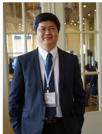
▲ 2024 年攝於美國舊金山

性格安靜內向，習慣觀察多於表達，享受獨處、欣賞花草，凡事不急，卻持續累積。國小二年級後，全家遷至中壢眷村，學長依舊保有恬淡節奏，穿梭巷弄步行上學，體會童年最純粹的踏實感。對自然與生命的親近，也呼應著父親家族早年在大陸經營中藥舖的淵源背景。即使遷台後家道轉折，「醫藥」二字始終潛藏心底，最終引領他進入長達數十年的生技探索之路。