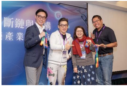
▲ 頒發 TEN 互助精神獎

成長的印記。自由交流的時刻到來，笑聲、碰杯聲與再次重逢的喜悅交織成一幅動人的畫面，為整個阿里山之夜增添了最溫暖的序章。