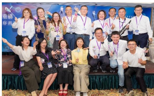
▲ 台北分會會員合影