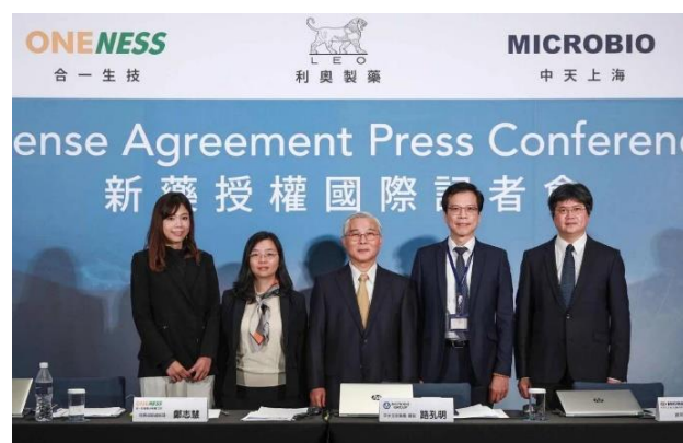
▲ 與丹麥藥廠簽署國際授權記者會

學長帶領「純台灣團隊」，在許多製藥前輩的加持下，將張老師研發的抗體藥物「FB825」，從一段基因序列一路推進到臨床試驗與國際授權。2020年，在全球疫情最嚴峻時，學長與團隊完成了台灣生技史上具代表性的國際授權案——將一個用於過敏性疾病的抗體藥物以 5.3 億美金外加未來銷售分潤的合約授權給丹麥藥廠 LEO Pharma。面對眾多國際大廠，團隊最終選擇理念契合的夥伴。他感性道：「我們不希望藥物被大廠拿去冷凍，而是希望它能真正解決病人的痛苦。」這份以人為本的堅持，至今仍是他的職業生涯中最自豪的成就。這段歷程，也讓他深刻體會到：真正具競爭力的產業，需要長期耐心、跨界理解，以及對專業的高度誠實。