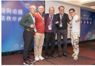
▲ 致謝入會 15 年資深會員