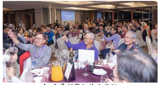
▲ 會員們舉杯彼此互祝