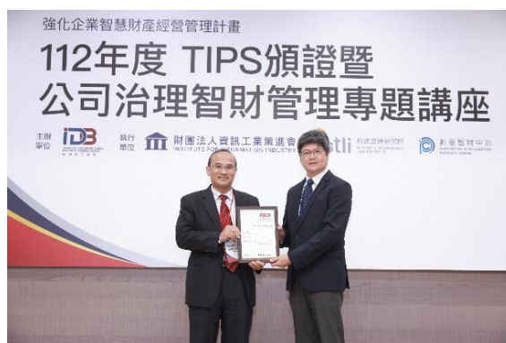
▲ 2023 代表公司接受 TIPS 認證

見識到學長姐們臥虎藏龍的組織動員力，都讓他深刻感受到清華人那份「越優秀、越謙遜」的特質。對於學長而言，在 TEN 的連結裡，不僅是事業上的盟友，更是生命旅途中，共同探索「共好」真諦的同行者。