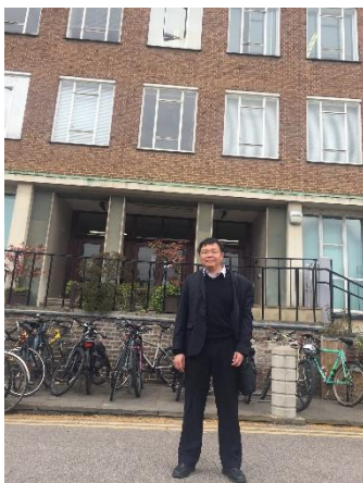
▲ 2017年回劍橋化學系館前留影