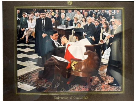
▲ 博士畢業典禮，院長用拉丁文唸祝禱文

一聊到清華時期的求學時光，學長似乎馬上回到時光隧道裡，臉上充滿了青春時期的純真笑容，除了專業領域的學習，跨系、跨校的交流聯誼活動，最讓學長侃侃而談、念念不忘，這段課外社交活動經驗，豐富了學長的大學求學生活，也成為同窗好友間茶餘飯後情感交流的回憶。學長接著分享了在英國帝國理工學院及劍橋大學，進修物化碩博士的海外學習時光，劍橋是一個非常適合做研究的學校，然英國的學術風氣，相較於國內是更自由及自主的，學長謙虛的說或許是個性使然，對於自身有興趣的事必然會做到極致，在嚴謹的學術研究生活中，學長仍不忘參加各種音樂會、歌劇，並分享與不同群體互動的趣事，反映了學長在學術研究與社交活動之間總能找到平衡。