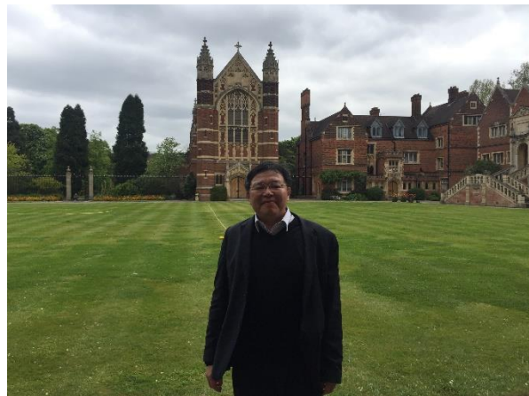
▲ 2017年劍橋 Selwyn College 庭院留影