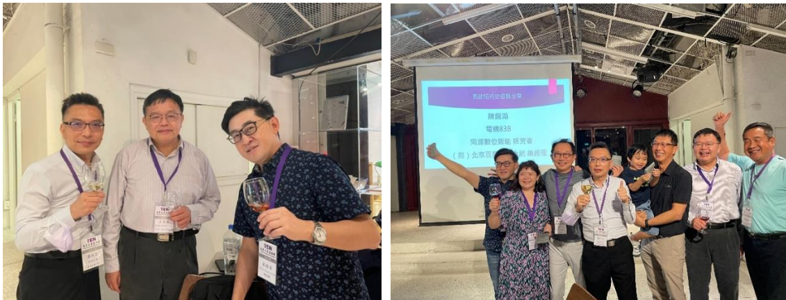
▲ TEN 會員間氛圍融洽的成長交流

學長表示 TEN 是一個非常友善、溫馨的大家庭，在 TEN 的這個組織裡，不論資歷、經驗都可以互相交流、分享，同時在輕鬆的氛圍裡，有機會促成彼此的合作，TEN 不同於其他人數龐大的商業組織，也因為人數不多的獨特性，讓每一位學長姐身上的不同，都有機會被看見，進一步成為組織裡所有成員的滋養，一起成長、一起茁壯，所以學長非常享受在 TEN 參與活動，與所有學長姐一起交流的時光。