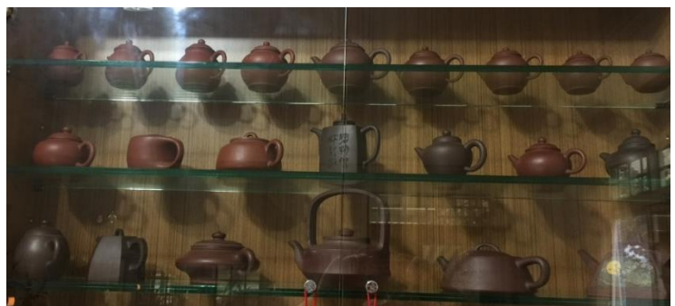
▲ 學長廣泛的興趣收藏之一

如今學長也晉升為一位父親，從緊湊的工作節奏，轉為選擇兼職獨立顧問的工作，為了能有更多的時間陪伴家人。學長以清朝文人查為仁這首詩：「琴棋書畫詩酒花，當年件件不離它；而今七事都更變，柴米