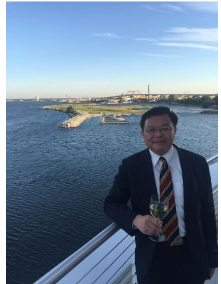
▲ 隨郭董到 Wisconsin 考察

域的技術開發，為自己走出了另一條道路。博士學位研修畢業後，為了照顧家人，放棄加入英國新創公司的機會，回國後的第一份工作，在鴻海集團法務室帶領具有相關科技背景的員工解讀專利，後來因為一個機緣，當兵時期的同袍，其在光電業的公司想轉型從事醫療器材，邀約學長加入，學長運用光電技術，開發醫療檢測設備像生物晶片分析儀、化學冷光儀、呈色分析儀、微流體晶片分析儀等設備，而這些儀器在台灣、美國、大陸申請了幾十個專利，開啟了學長在醫療器材技術的職涯道路。