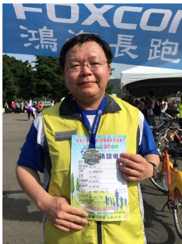
▲ 路跑九公里完賽證明

後來郭董因為家人因病過世，而成立了永齡基金會，於是學長在 2011 年再度回到鴻海集團加入旗下的永齡，並參與集團轉向醫療科技領域發展的許多重要決策，例如：建置食品安全實驗室，開發快速檢測農藥技術；整併 Sharp 生醫項目，評估生技醫療的投資案像矽谷惡血案等。在鴻海服務的九年時間，學長幾乎都隨召隨到，基本上可說是使命必達，2018 年間，學長檢查出肺癌，印象非常深刻，當時開完刀從恢復室才剛回到病房，立刻就接到公司來電詢問資料，工作節奏可謂非常的緊湊。