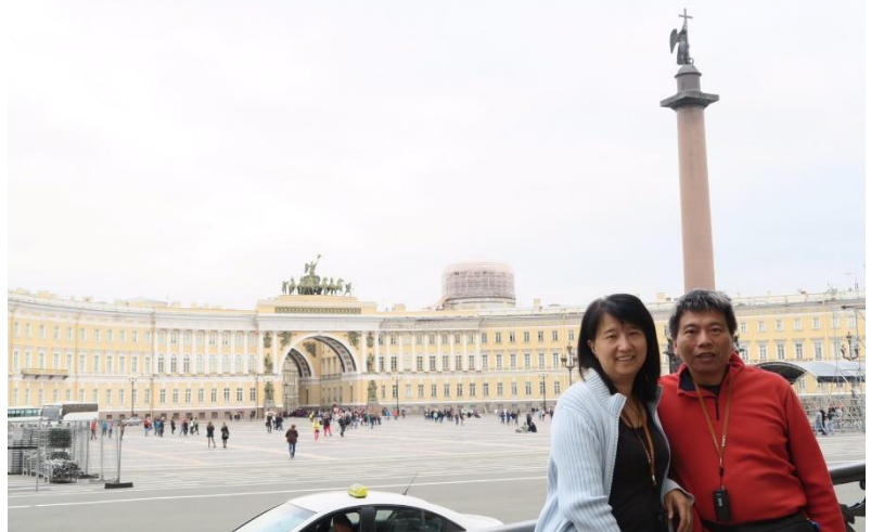
▲學姐與先生出遊時合照

學姊在 2003 年時進軍大陸，這個機會是學姊爭取多年才爭取到的機會。任職怡富證券期間，公司被 JP 摩根併購，雖然 JP 摩根一直希望能夠將版圖拓展至大陸，但苦於當時大陸並未開放，即使公司版圖尚未延伸至大陸，每年學姊都還是向公司表明到大陸工作的意願，學姊稱之為「掛號」，直到 2003 年台灣與大陸都加入 WTO 後，才開啟了這座大門。當學姊的主管徵詢擔任合資公司總經理的意願，反而讓學姊懵住了，雖然到大陸發展是學姊夢寐以求的機緣，但當時學姊已經有了三個孩子，最小的才三歲，學姊原以為需要花費許多心神與力氣與先生討論這件事情，沒想到學姊的先生比學姊還興奮：「你不是一直想去大陸嗎？我們走吧！全家一起去，家裡的事情你不需要擔心！我自己想辦法！」在先生的支持下，學姊舉家帶著航海王的冒險精神遷徙至大陸，這件事情對於學姊的影響十分深遠。