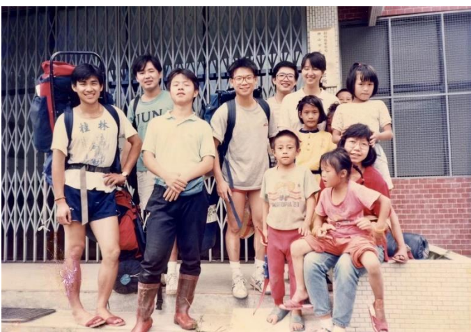
▲與山服社在當時的秀巒村養老派出所合影 (現已因坍方而消失，成為峽克羅步道區)

讀基隆女中，為自己省下每天兩小時來回的通勤時間與三年的學雜費。在高中階段考量當時基隆女中的社會組師資強於理工組，但當時清華多數是理工科系，學姐對於經商做生意有濃厚興趣，因此清華經濟系成為了學姐首選。