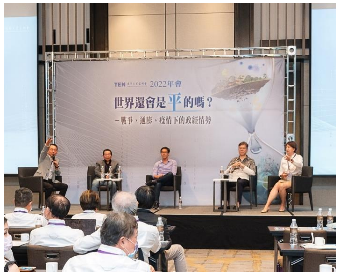
▲2022年第十五屆年會論壇與談人

的體現，就像金老師，即使已經是所有人眼中的大學長，面對台上年紀比自己小一截的分享者，還是願意非常認真誠懇地詢問，常常讓學姊忍不住告誡自己的孩子「沒有驕傲的權利」，學姊甚至認為，任何驕傲的人，到了TEN應該都會不自覺的謙虛起來。