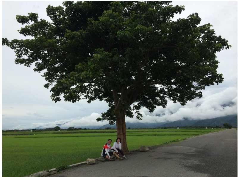
▲學姐與先生出遊時合照

在大陸工作的這些年，對學姊來說是個除魅的過程，過去在台灣工作，可以直接複製美國的模式到台灣市場中，可以憑本能工作，大環境非常好，但到了大陸，學姊重拾經濟學課本，重新細讀凱因斯的全套書籍，重新學習大陸的模式，讓監管人與同事接受新觀念，這也打開了學姊的視野。學姊所說的除魅，不僅是魅力，也是鬼魅與魅惑，遍地機會的大陸市場，其實也是遍地風險，危機四伏，對學姊而言是一場大冒險，學姊的先生也讓全家把這個過程當作一個比較長又能順便賺錢的大旅行，再度凸顯了學姊與她的先生面對挑戰的積極樂觀與正向。