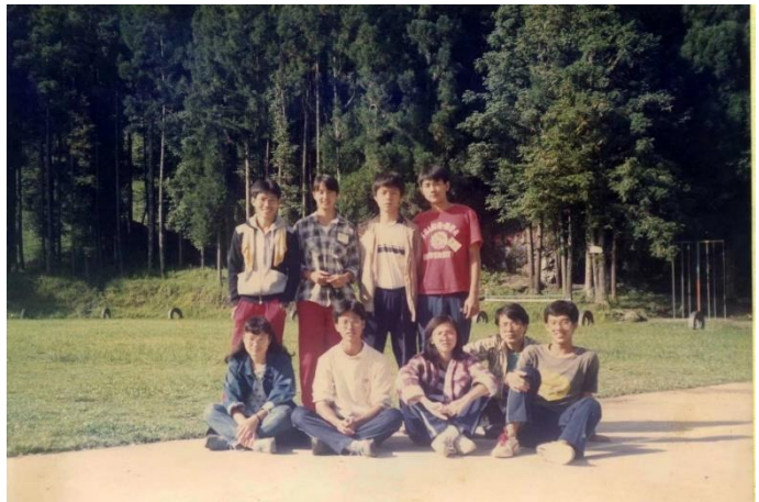
▲與山服社在新光國小操場合影

學姊在小時候曾經參加過童子軍，跟著小學一起來清華參觀，對清華的大草皮與學校的宏偉留下深刻的印象，認為「有為者應如是」，對清華產生了憧憬。學姐笑著說是自己自小就很會「算計」，在國中階段，老家在基隆女中附近，在評估通勤時間與當時的招生方案，學姊毅然決然就