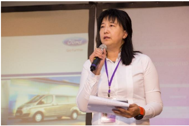
▲2016年第九屆年會論壇主持人

一路走來，學姊面對各項挑戰都抱著堅定如一的正向與樂觀，在訪談中，經常將「好玩」、「挑戰」、「不無聊」等字眼掛在嘴邊，不難讓人感受到學姊對於各項挑戰與困難無所畏懼的熱情與堅毅。問起學姊對未來的規劃與想像，學姊笑言自己並非一個會做長遠計畫的人，對現階段的她而言，她期待的是可以「一路玩到掛」、不留遺憾的人生，到人生的最後一天都應該要充滿趣味，才能不負此生！