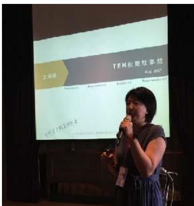
▲2015 年秋聚故事館分享

學姊說 TEN 給他的感覺就像山服社一樣，不管是參加 TEN，或是山服社，都是彼此互相提攜，像山服社，自己爬山是難免的，也需要知道如何野炊等技巧，不管自己動作笨拙還是不懂生火，只要願意學，在團體中有所貢獻，就能獲得更多。其中學姊對 TEN 的學長姐特別感佩，明明在各自領域已經擁有非常崇高的成就，但還是保有非常謙虛誠懇的求知慾，賈伯斯說的「Stay foolish, stay hungry」，在 TEN 的活動與學長姊身上有非常明顯