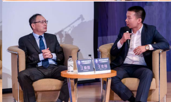
▲ 綜合座談互動分享