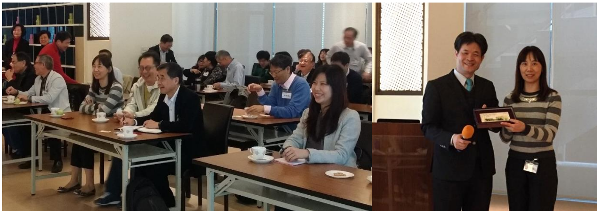
【講者們風趣解說令底下聽眾開懷大笑】

醫學已經不再是單就病症而醫，而是針對個體健康找出病因，扼殺讓身體功能異常的源頭，才是生命長久之道。