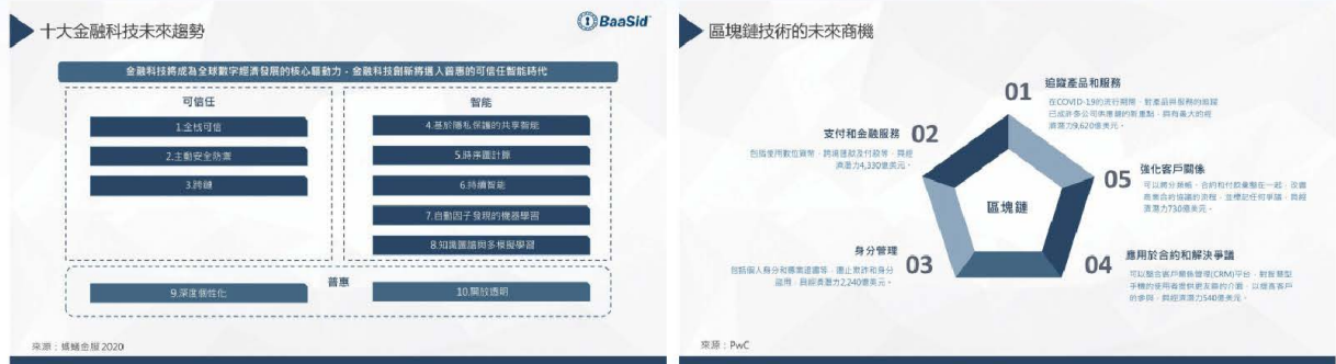
▲十大金融科技未來趨勢