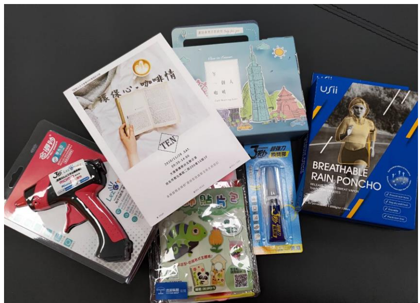
▲豐富精美的伴手禮